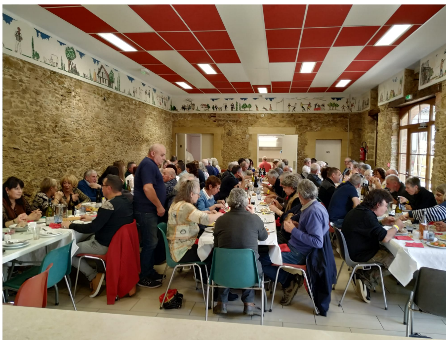
Comité de rédaction : Mairie de Lias