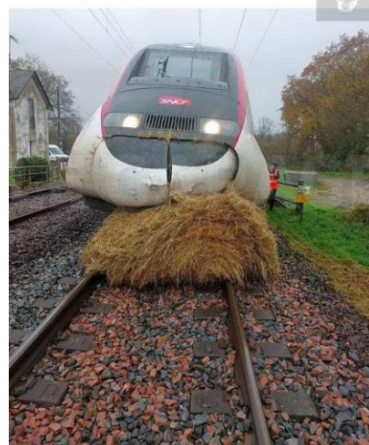
Rare image du premier TGV herbivore du monde